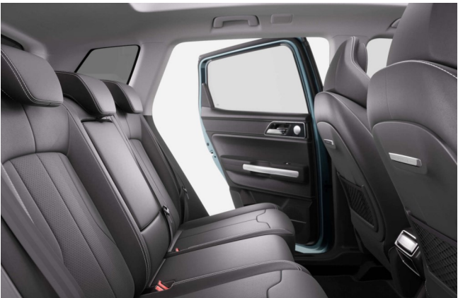
PRIME Leder Innenfarbe Schwarz / Cuir intérieur noir/Pelle interno nero