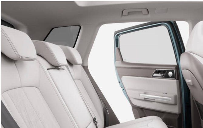
PRIME Leder Innenfarbe Cremeweiss / Cuir intérieur blanc crème Pelle interno bianco crema