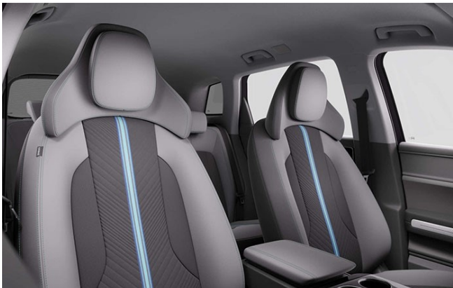
XCITE Textil-Interieur / intérieur textile / interno in tessuto